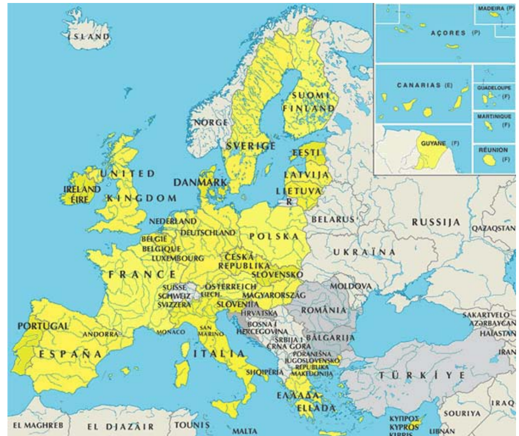
Mitgliedsstaaten in Europa seit dem 1. Mai 2004

Der Ausbau regionaler Zusammenarbeit ist in allen Erdteilen feststellbar. Damit zeichnen sich auf der politischen Weltkarte einige neue Konturen ab. Es dreht sich in erster Linie um die NAFTA (North American Free Trade Agreement), den MERCOSUR (Mercado Común del Sur) für die südlichen Lateinamerikanischen Länder, die ASEAN (Association of South East Asian Nations) und als neuestes auch die AU (African Union). Letztere besteht aus den drei kleineren regionalen Zusammenschlüssen der ECOWAS (Economic Community of West African States), der EAC (East African Community) und der SADC (Southern African Development Community). ↓